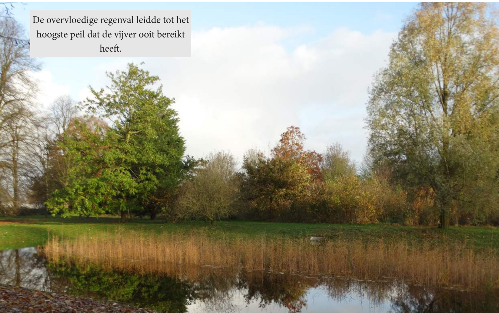
De overvloedige regenval leidde tot het hoogste peil dat de vijver ooit bereikt heeft.