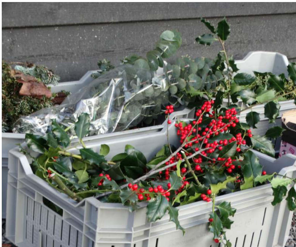
Kerstgroen uit de tuin ten behoeve van de advent workshop

In de late middeleeuwen werd de kerstboom als symbool door de christenen in Oost-Europa, de Duitse gebieden en Scandinavië overgenomen.