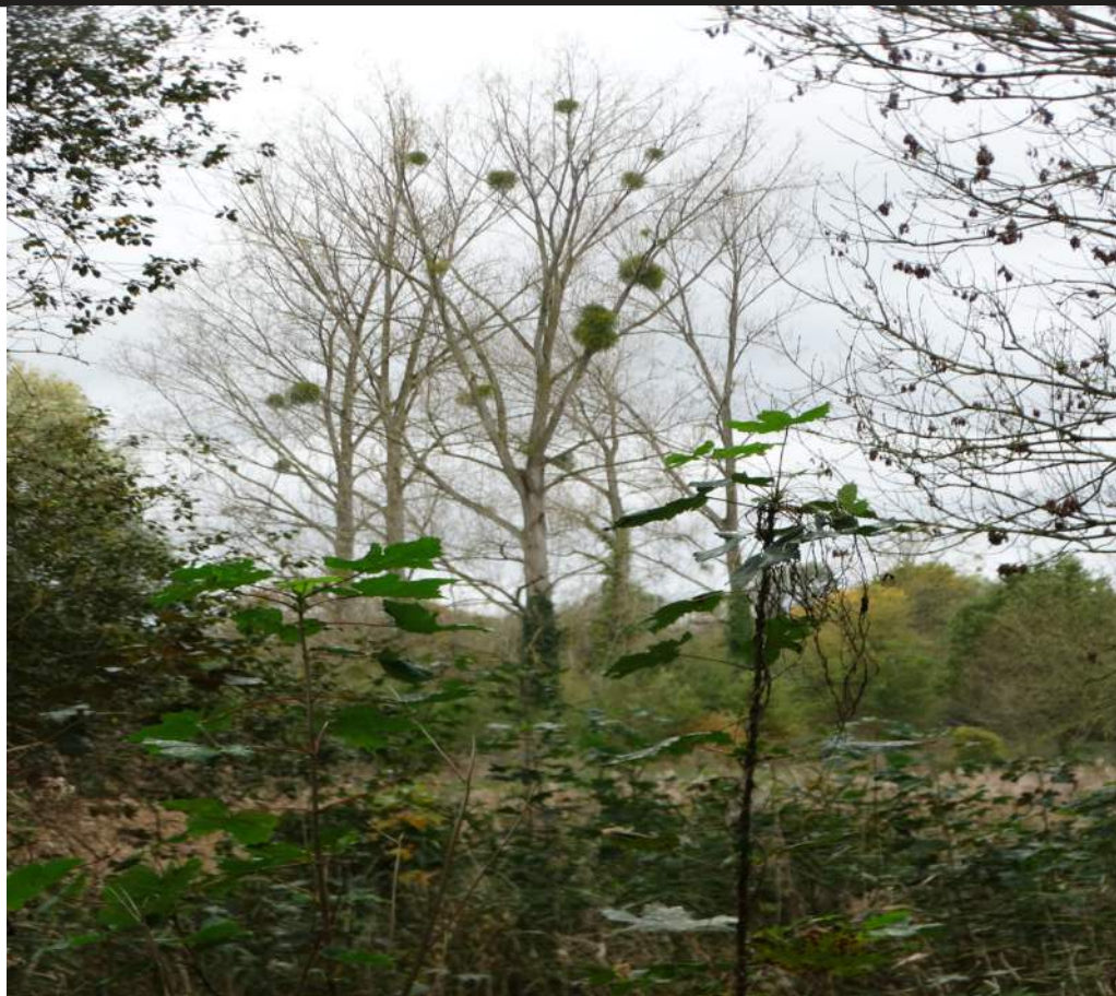
Maretak (Bilzen, Belgisch Limburg)

Het is een halfparasiet die groeit op appel- en perenbomen. Kort voor corona was ik op bezoek bij de beheerder van de monumentale kruidentuin in het Openluchtmuseum te Arnhem. We spraken af dat ik een aantal bessen op zou komen halen, einde jaar, om deze in te wrijven bij enkele appelbo-