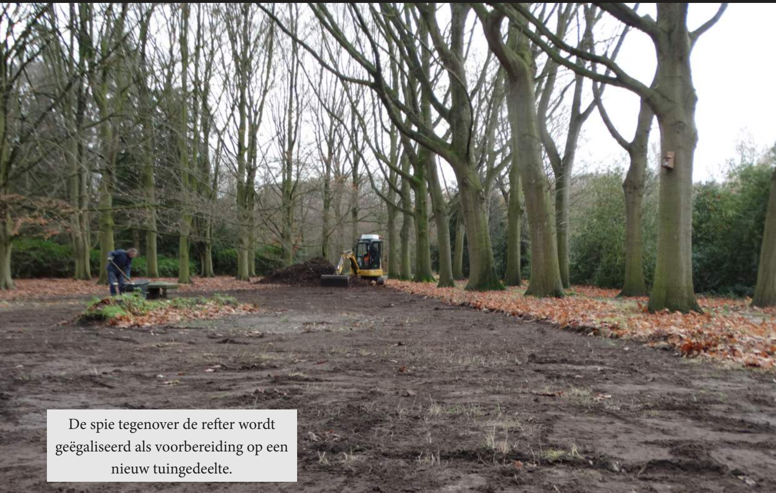
De spie tegenover de refter wordt geëgaliseerd als voorbereiding op een nieuw tuingedeelte.